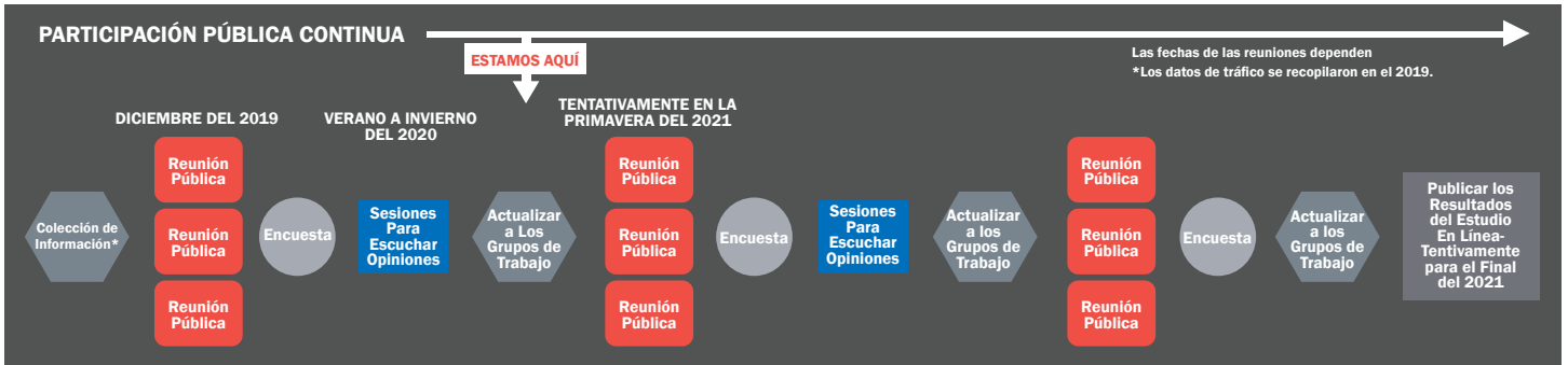
Cronología del Estudio de I-345