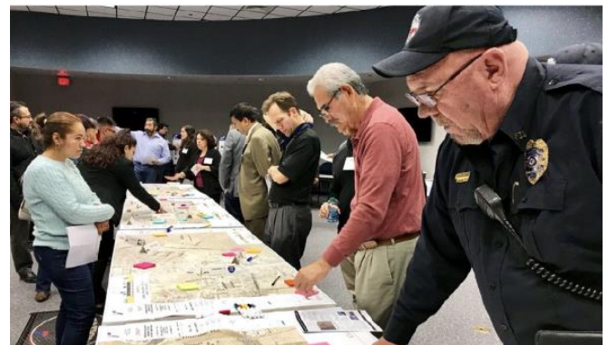
Primera ronda de reuniones públicas, febrero 2018.