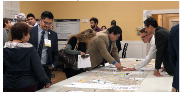
Segunda ronda de reuniones públicas, enero del 2019.