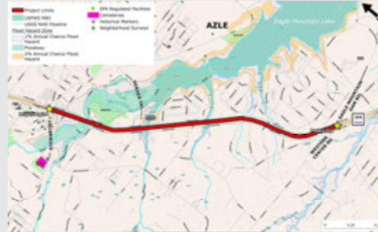
Mapa de Restricciones Ambientales

La revisión ambiental, consultas y otras acciones requeridas por las leyes ambientales federales aplicables para este proyecto están siendo realizadas, o han sido realizadas, por TxDOT conforme a 23 U.S.C. 327 y un Memorando de Entendimiento fechado el 9 de diciembre de 2019, y ejecutado por FHWA (Federal Highway Administration) y TxDOT (Texas Department of Transportation).