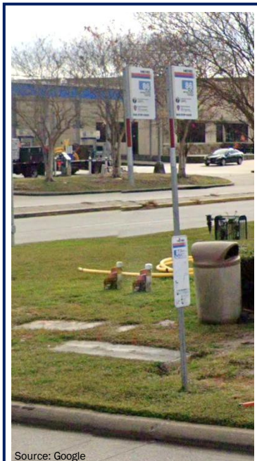
Fotografía de ejemplo de una parada de autobús Metro existente a lo largo de la FM 1960 sin plataforma de concreto