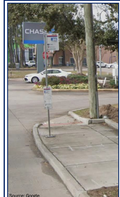
Fotografía de ejemplo de cómo se vería una parada de autobús de Metro con una plataforma de concreto como se propone