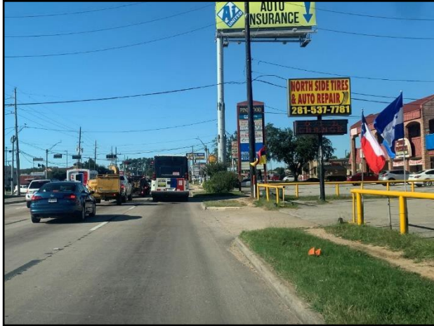
Ejemplo de caminos peatonales existentes a lo largo de la FM 1960

Reunión Pública Presencial 7 de abril de 2022 5:00 p.m. a 7:30 p.m.