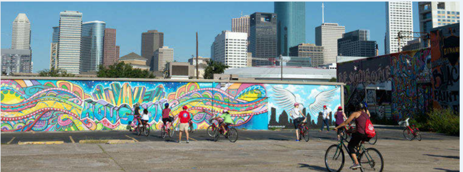
Nuevas instalaciones peatonales y de ciclistas pueden construir conexiones en el vecindario

Tanto si estos hogares son para inquilinos como si son de propietarios de viviendas de ingresos fijos, proporcionar estas mejoras esenciales es parte del esfuerzo de TxDOT por mantener a los residentes en sus hogares para que puedan seguir contribuyendo al tejido social de su comunidad.