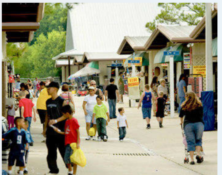
Nuevas mejoras peatonales en todos los cruces y conexiones con elementos peatonales actuales.