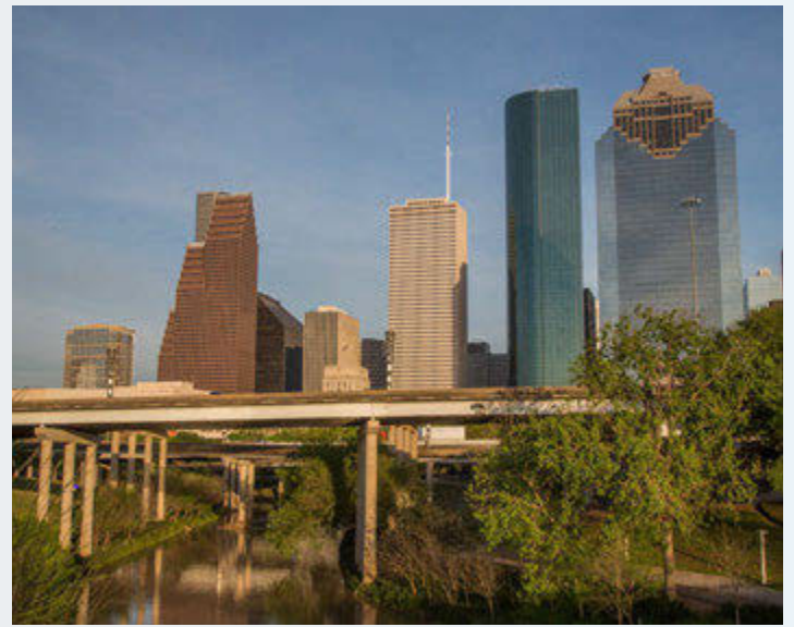
El proyecto de Mejora de Carreteras del Norte de Houston es el proyecto de transporte más grande de la historia reciente de nuestra ciudad.

El objetivo de TxDOT es ayudar a los hogares y a las personas a mantener sus redes de apoyo social actuales. Las interrupciones asociadas con el traslado pueden afectar el acceso de un residente a una estructura social fuerte construida con el tiempo. Esto puede incluir actividades comunitarias (iglesia y escuela) y otras rutinas regulares como compras de comestibles, cuidado de niños y servicios médicos. Las circunstancias individuales variarán, pero las poblaciones minoritarias, de bajos ingresos y de escasa competencia en inglés pueden ser especialmente vulnerables a tales impactos. TxDOT trabajará diligentemente para tratar de evitar que tales efectos ocurran.