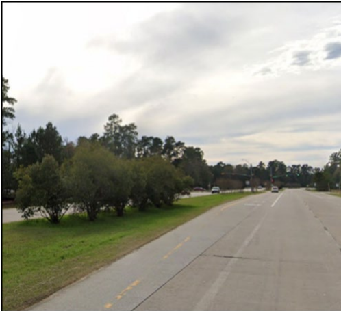
SH 242 cerca de Greenbridge Drive

opción presencial: jueves 23 de junio del 2022 desde 5 p.m. a 7:30 p.m.