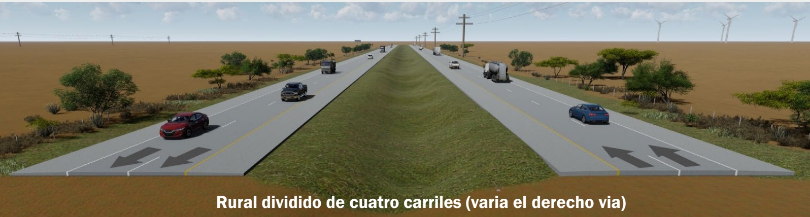
Rural dividido de cuatro carriles (varia el derecho via)