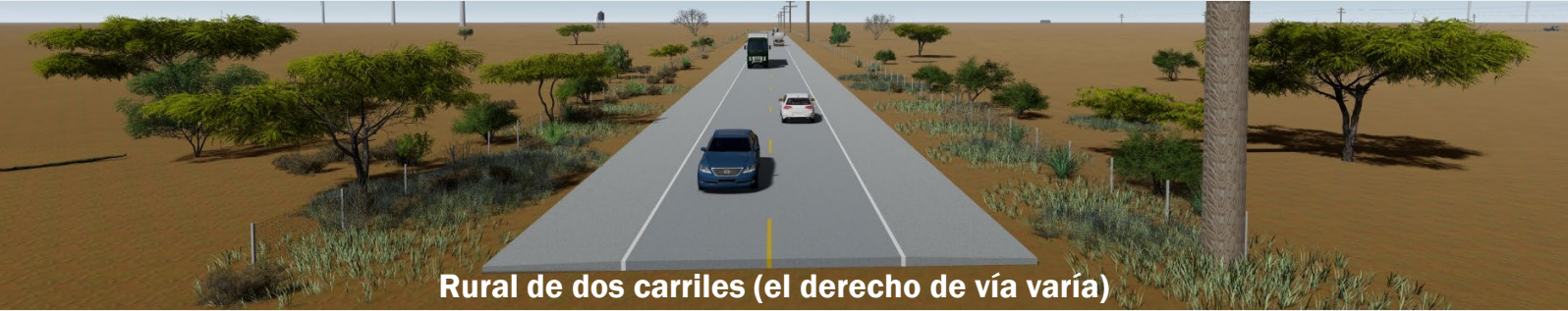
Rural de dos carriles (el derecho de vía varía)