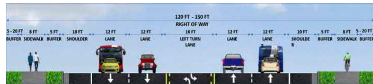
Sección Propuesta de la Carretera