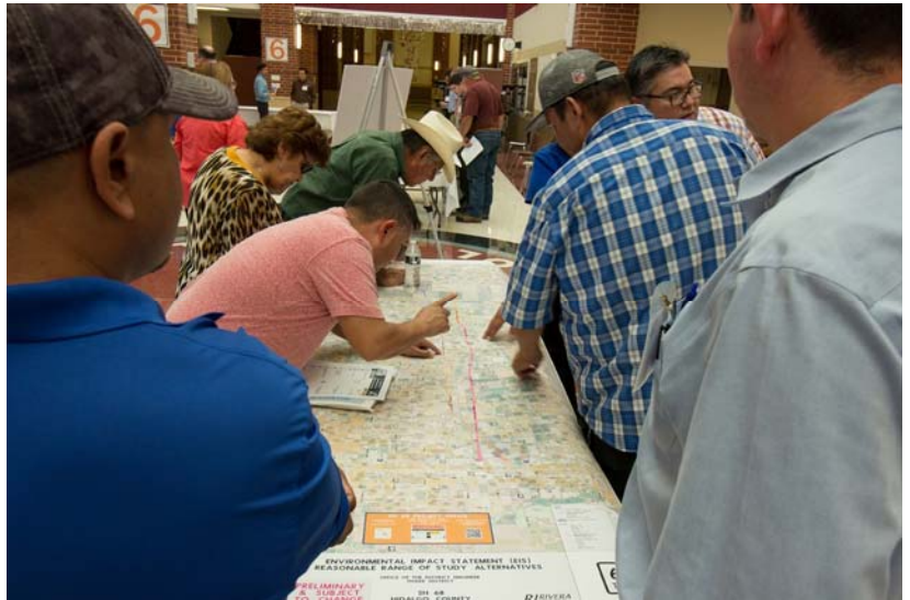
Reunión Pública (el 3 de enero del 2017)

El objetivo del proyecto SH 68 es acomodar el crecimiento demográfico, y los altos volúmenes de tráfico, mientras que se alivia la carga en el número limitado de vías existentes con dirección de norte-sur, y añadiendo una ruta adicional de evacuación durante eventos de emergencia.