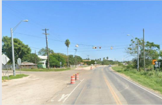
US 281 (Military Highway) cerca de la intersección FM 732