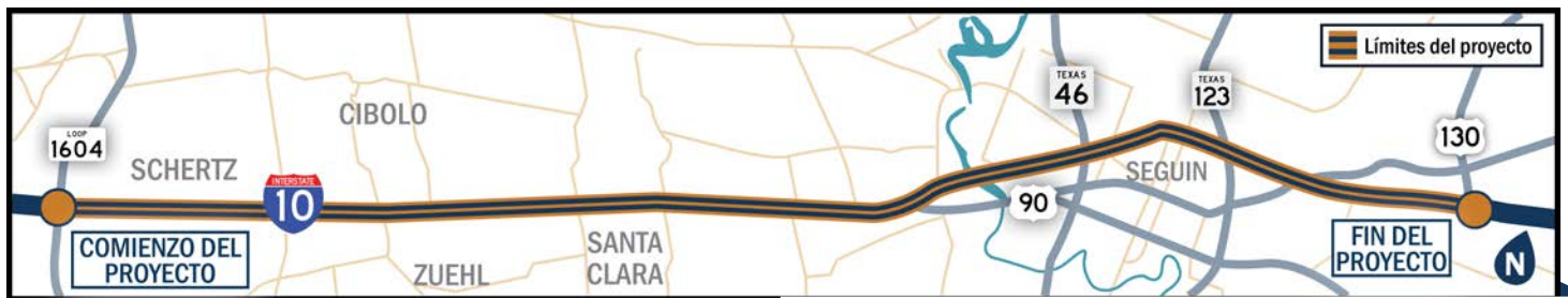
MAPA DE UBICACIÓN DEL PROYECTO

En 2016, el Departamento de transporte de Texas dio prioridad a aproximadamente 27 millas de la I-10, entre el Loop 1604 y SH 130, para la evaluación.