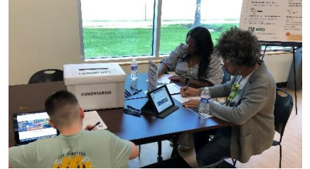
Reuniones públicas, primavera de 2023